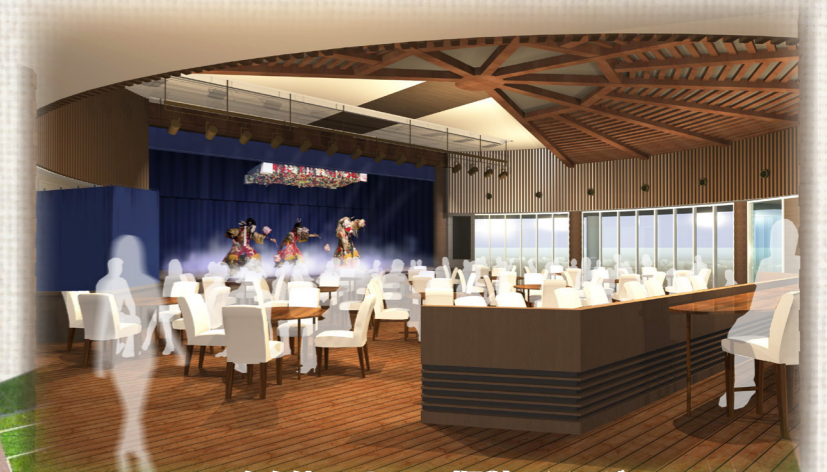
△舞台付レストラン（仮称）イメージ

北広島の食材にこだわった健康志向のメニューをビュッフェスタイルで提供します。食事とともに田楽や神楽が鑑賞できる舞台を備えたレストランです。