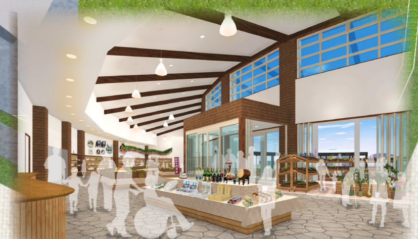
△産直・物販（仮称）イメージ

431㎡の広々とした店舗空間で、北広島産の米、旬の野菜、特産品や土産物、また、テイクアウトメニューや焼きたてのパンを提供します。